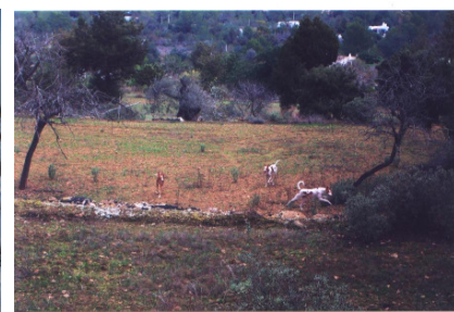
Podencos bei der Jagd in Spanien