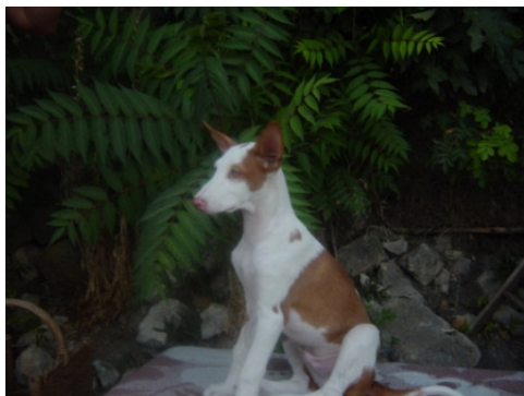
Unser Amigo mit 3 Monaten noch in Spanien

Ich könnte meinen Amigo mit keiner anderen Hunderasse vergleichen und würde mich immer wieder für einen Podenco Ibicenco entscheiden. Gerne stehe ich bei Fragen zum Podenco Ibicenco hilfreich zur Verfügung.