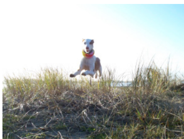
Ein Podenco kennt keine Hindernisse